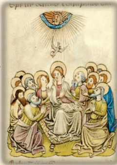
45.- Pentecostés: la venida del Paráclito