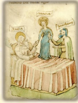
1.- Nacimiento de la Virgen María