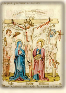
39.- A dos ladrones crucificaron con Él