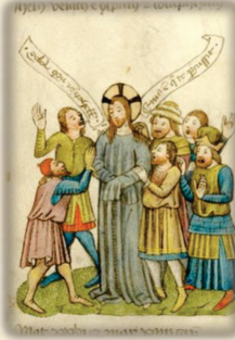
29.- Es burlado e insultados