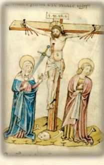
36.- La Virgen es la reina de los mártires