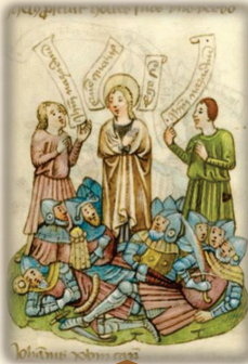
25.- "Yo soy"; dijo a los soldados