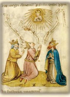
8.- Anuncio a los Reyes Magos