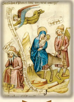
13.- El sueño de José