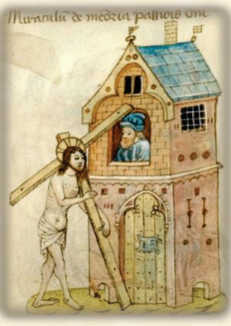
33.- Con la cruz auestas