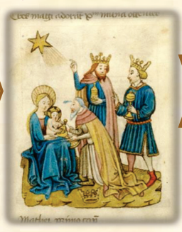
9.- Siguieron la estrella y hallaron al Niño