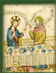
43.- Resucitó al tercer día (Gana un turno)