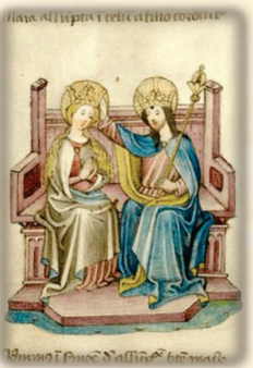
48.- María Santísima es la Reina del Cielo