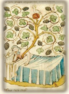
6.- "José, no temas recibir a tu esposa"