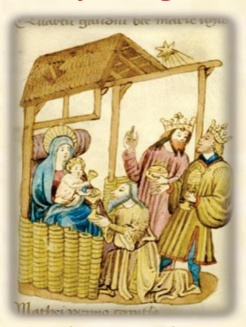
10.- Adoración de los Reyes Magos