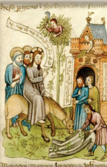
20.- Entrada triunfal en Jerusalén