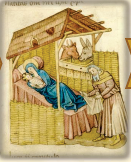
7.- Nacimiento de Jesús en Belén