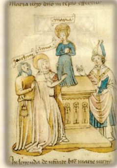
2.- Presentación de la Virgen al Templo