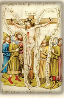
38.- Es atravesado por un lanza