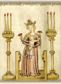
15.- El Niño crecía en estatura y sabiduría