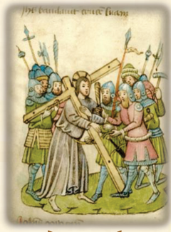
34.- Camino al calvario