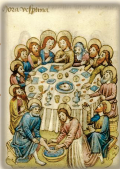
21.- Jesús lava los pies a sus discípulos