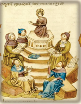
16.- A los 12 años con los doctores