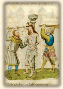
30.- Es cruelmente flagelado