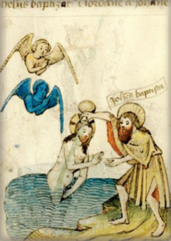
18.- Bautismo del Señor en el Jordán