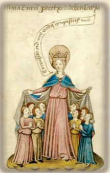
49.- Virgen Madre de misericordia