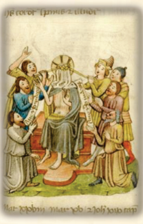
31.- Es coronado de espinas