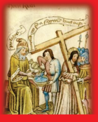
32.- Pilato de lava las manos (Pierde un turno)