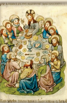
22.- Institución de la Eucaristía