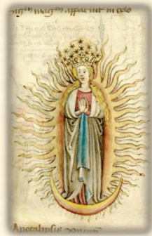
46.- Asunción de la Santísima Virgen