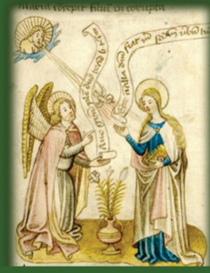
4.- La Anunciación (Gana un turno)