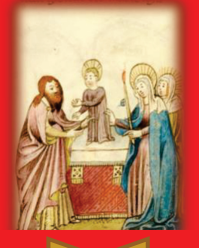
12.- "Una espada atravesará tu corazón" (Pierde un turno)