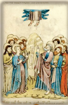
44.- Ascendió a los cielos