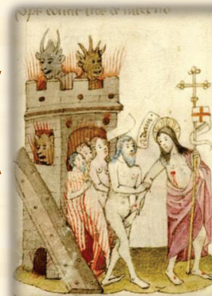
42.- Descendió a los infiernos de los justos