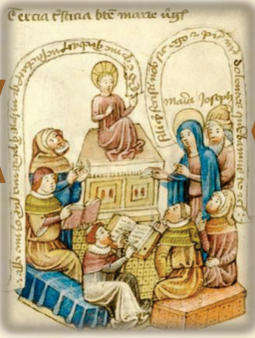
17.- "Tu padre y yo te buscábamos"