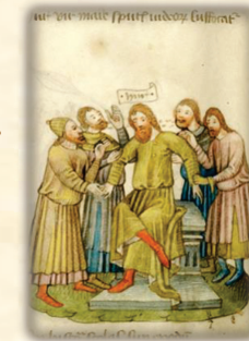
28.- Es cobardemente abofeteado y escupido