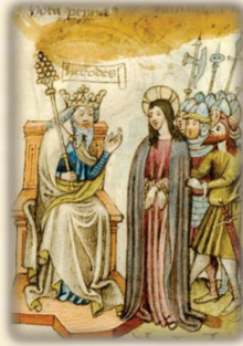
27.- Ante Herodes no pronunció palabra