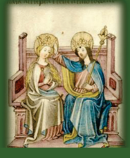
47- Coronación de Santa María (Gana un turno)