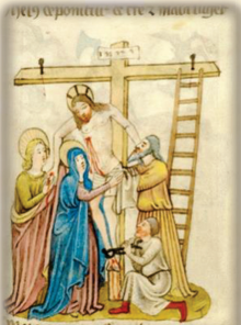
40.- Es bajado de la cruz. La Piedad