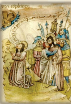
23.- Jesús ora en el huerto de los olivos