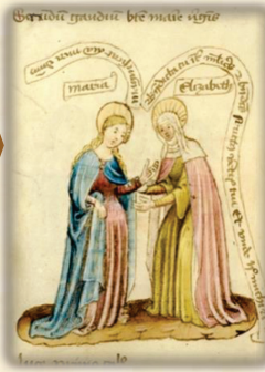
5.- Visitación de la Virgen a santa Isabel