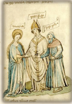
3.- Desposorios de la Virgen con san José