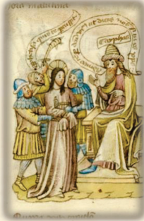
26.- Es juzgado injustamente