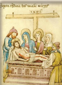
41.- Es colocado en el santo sepulcro