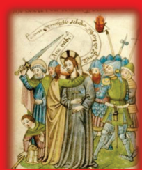
24.- El beso traidor de Judas (Pierde un turno)