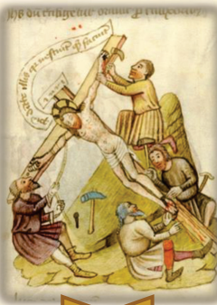
35.- Es clavado y levantado en la cruz